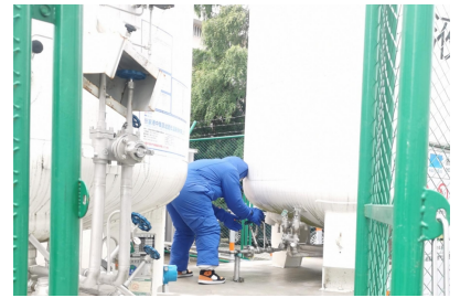
7月7日 我院举行液氧泄露应急演练活动