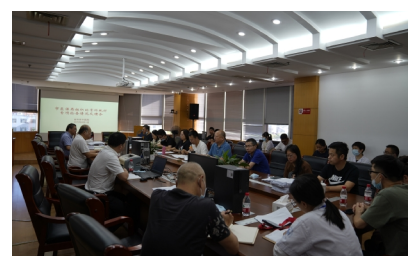
8月3日 市医保局组织的骨科耗材专项检查情况反馈会