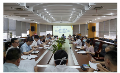
7月25日 我院召开等级医院评审二类指标达标情况阶段分析会