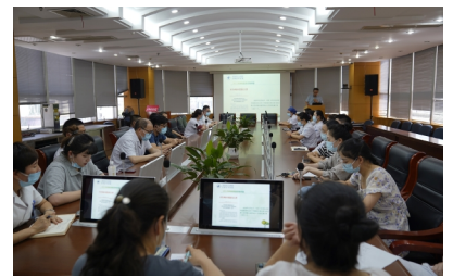
7月20日 我院召开2022年网络监督员专题培训会